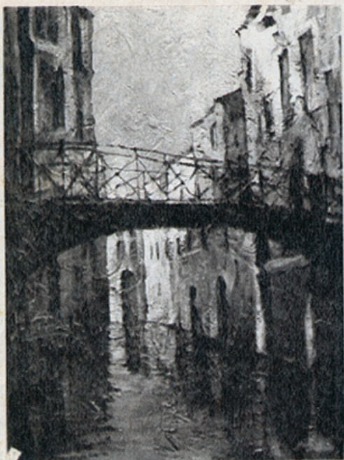
BORO-SUFFO: Paisaje veneciano. Premio Hotel Macarena.